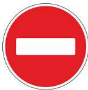
Знак 3.1 «Въезд запрещен»