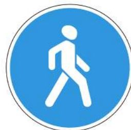
Знак 4.5.1 «Пешеходная дорожка»