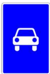
5.3 «Дорога для автомобилей»