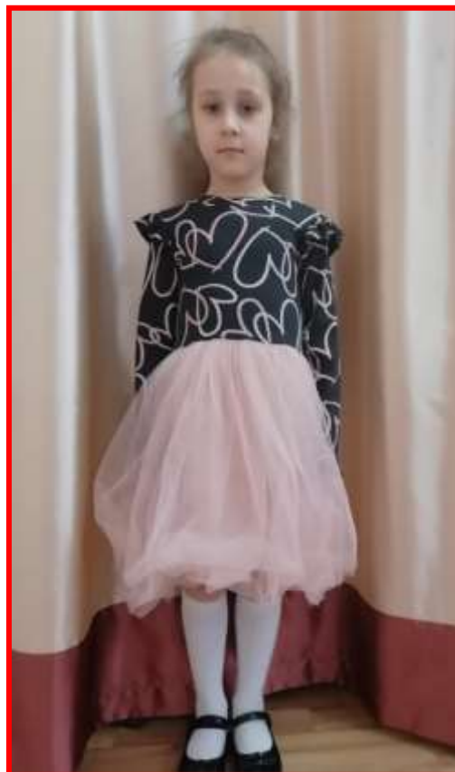
Ушкова Дарья (5 лет)