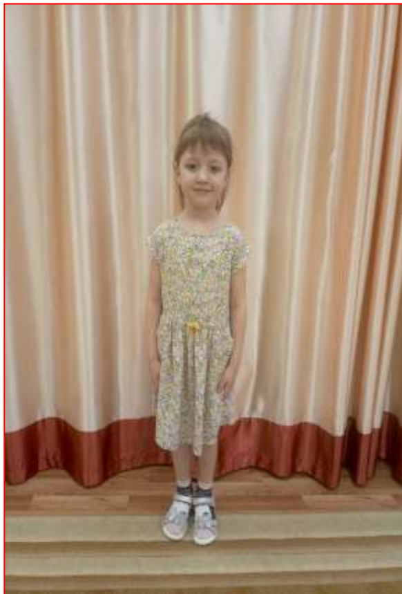
Безотеческая Мирра (5 лет)